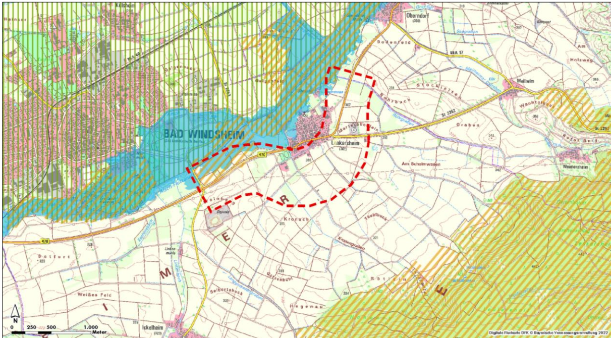
Abbildung 1: Übersicht zum Standort (rot) des Trassenneubaus mit Darstellung des Überschwemmungsgebiets (blau), dem Naturpark (grün schraffiert) und des Landschaftsschutzgebietes (orange schraffiert)