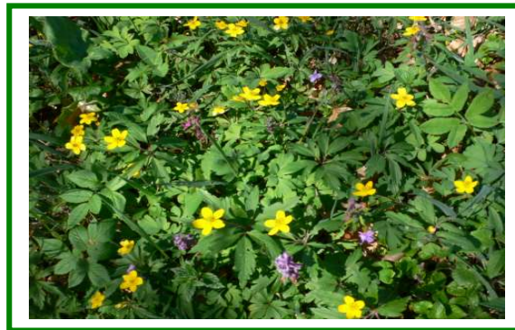
Gelbes Windröschen und Lerchensporn

Auch die Waldlebensräume sind durch die Geologie geprägt. Die mineralkräftigen Böden tragen Wälder reich an Eichen und Hainbuchen mit Elsbeere, Speierling und Ulme. Der Boden wartet im Frühjahr mit einem reichem Blütenfloor auf.