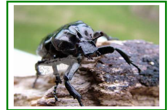
Eremit oder Juchtenkäfer

Der geheimnisvollste Bewohner des Endseer Bergs ist der Eremit ( Osmoderma eremita ) , ein einst in mitteleuropäischen Urwäldern weit verbreiteter Käfer. Nach seinem Geruch nach Leder wird er auch Juchtenkäfer genannt. Er ist sehr ortstreu und bewohnt jahrzehntelang in vielen Generationen mit seinen Larven Mulmhöhlen in starken, vitalen Laubbäumen. Nur gesunde Bäume können mit ihrem jährlichen Holzzuwachs den Verlust an Höhlenwand kompensieren, welche die Käferlarven mitsamt den darin lebenden holzbewohnenden Pilzen von innen her aufessen. www.biotopholz.de